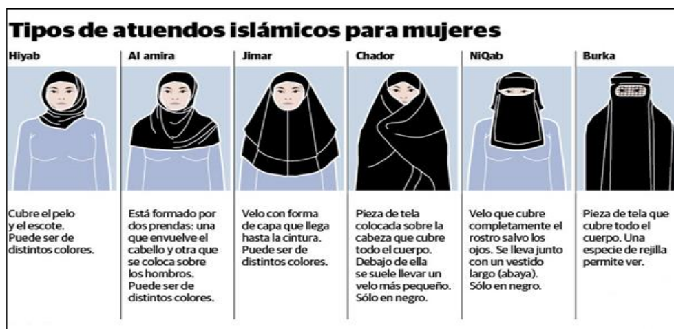
GRÁFICO 2 TIPOS DE ATUENDOS ISLÁMICOS PARA MUJERES

“Hiyab” es una palabra árabe cuyo significado etimológico es “ocultado o separado”. Sin embargo, dentro del Islam, “hiyab” significa mucho más que eso y se ha usado el término para referirse al velo islámico. Más que un mandato religioso, se trata de una norma islámica que dicta que la mujer debe cubrirse la mayor parte de su cuerpo. Es por esta razón que el hiyab simboliza modestia para los musulmanes y es necesario aclarar que detrás de este existen múltiples variaciones. Este se manifiesta con diferentes tipos de velo y su uso varía dependiendo en gran medida del país donde se lo ocupe. Por ejemplo, Emiratos Árabes establece que las mujeres deben utilizar “burqa”, el velo que cubre todo el cuerpo y rostro de la mujer dejando simplemente una rejilla en los ojos para que esta pueda ver. (BBC, 2009), (RHC, 2007). A continuación, una imagen de los diferentes tipos de velo: