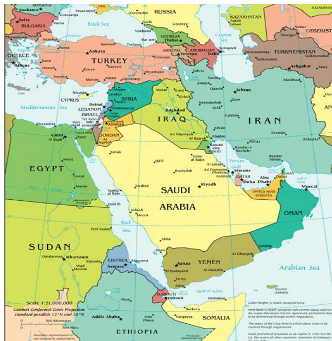
GRÁFICO 1 MEDIO ORIENTE

Fuente: CIA, The World Factbook Elaborado por: CIA, The World Factbook