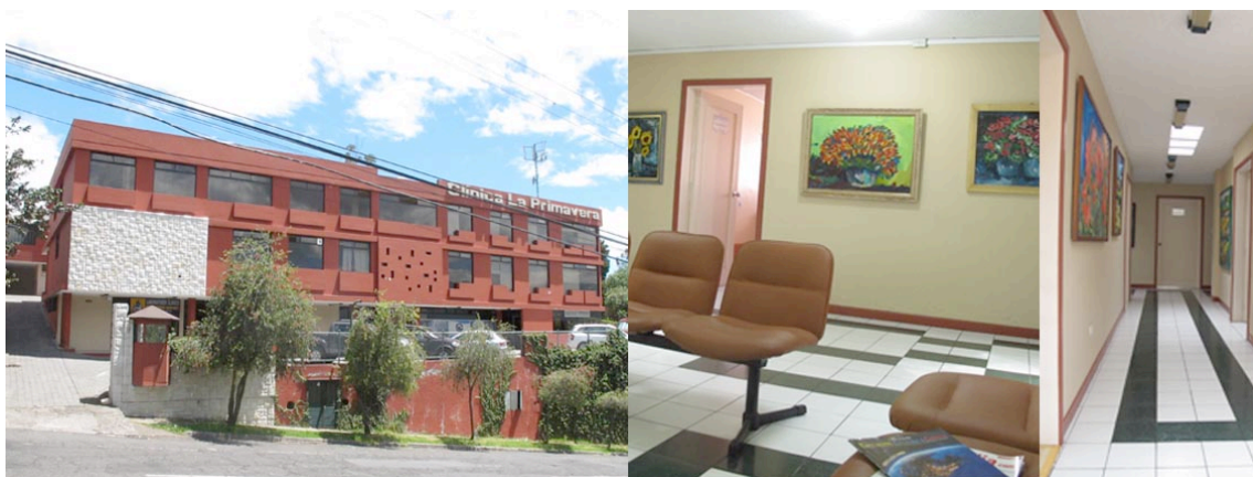
Imagen N. 1: Secuencia fotográfica de la Clínica Primavera, Cumbayá.

Las siguientes imágenes fueron tomadas en el marco del trabajo etnográfico de este texto, precisamente en la Clínica la Primavera. Se cree necesario mostrarlas, pues de este modo se deja ver uno de los escenarios diseñados y construidos para el parto humanizado, basado en las teorías que ya se ha expuesto. Cabe señalar que ésta Clínica es una de las más concurridas para el parto humanizado y parto en agua en Quito.