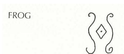
Imagen N. 7: Símbolo para representar una rana.