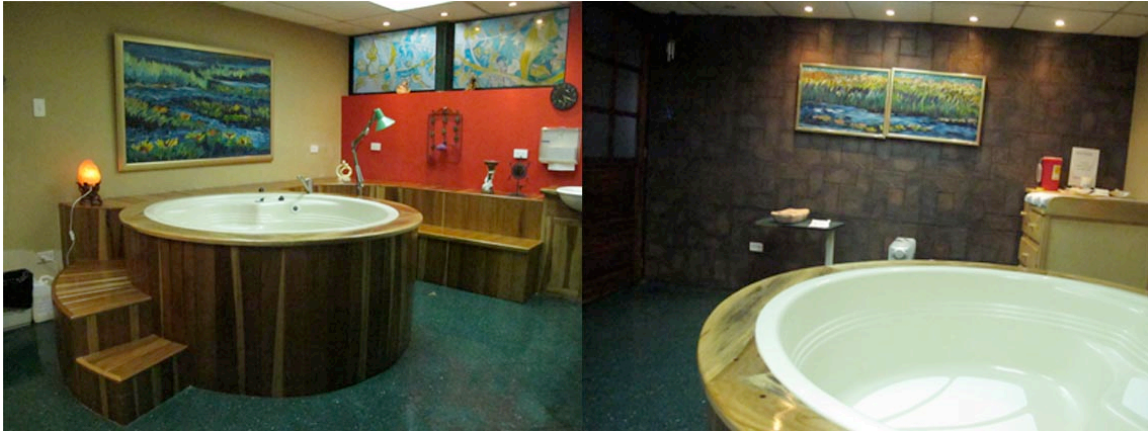
Imagen N. 4: Secuencia fotográfica las salas acuáticas de parto de la Clínica Primavera, Cumbayá.