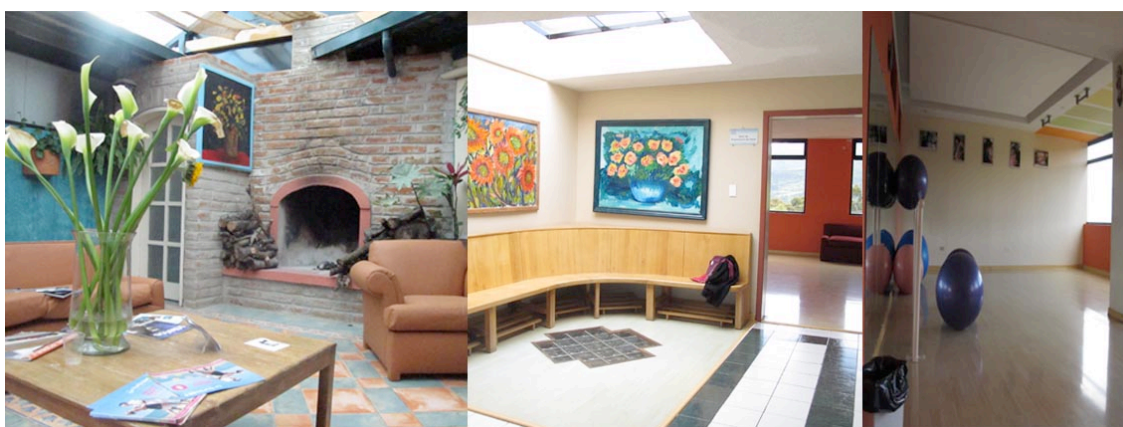
Imagen N. 2: Secuencia fotográfica de la segunda planta de la Clínica Primavera, Cumbayá.

La segunda serie de imágenes de La Clínica Primavera fueron tomadas en el segundo piso de la institución, este es un lugar menos accesible que el primero, en él se encuentran las habitaciones, una amplia y luminosa sala de espera con mucha vegetación, en ella hay una chimenea como se puede ver y también una televisión con un DVD en el que se pueden ver distintas entrevistas realizadas al Dr. Diego Alarcón y partos que han sucedido en esta clínica/maternidad. La sala de ecos que cuenta con tecnología para realizar ecografías en 3D y 4D. El espacio en el que se llevan a cabo las clases de preparación para el parto, en la misma sala si la mujer desea puede también pasar un tiempo de la labor de parto, sobre todo la de la dilatación. Estas imágenes muestran espacios no convencionales en los centros de atención al parto. Aquí hay una canoa amazónica repleta de ellas y varias otras macetas.