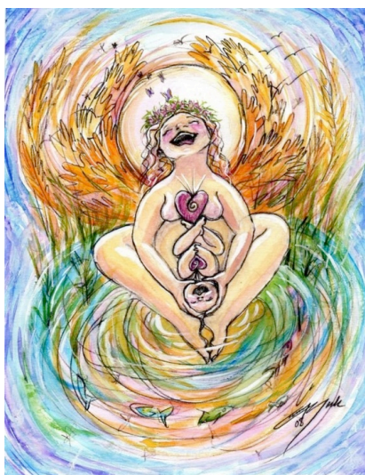
Imagen N. 12: Ilustración High Harvest Day.

La primera es una imagen que circula en Facebook, sobre todo en páginas que hablan de ginecología natural, ciclos de la mujer y parto respetado. Un dibujo: plano general, los personajes principales son una mujer de piel blanca y pezones rosados, embarazada, en una posición vertical, unida a su hijo, blanco también, por un corazón/cordón umbilical, ambos con expresión de alegría. La mujer es la que ocupa mayor espacio en el dibujo y se encuentra sujetando la cabeza de su hijo/a con las manos y de alguna forma conteniéndola también con sus piernas. Ella y la cría sonreídos y con ojos cerrados, ella hecha la cabeza hacia atrás relajada pero energética, ambos en exactamente la misma posición corporal; el fondo es un entorno en movimiento, de agua, naturaleza y luz. La mujer tiene atrás de su cabeza un círculo luminosos que recuerda al sol o a una aureola, la sensación que produce el fondo con la sonrisa y pose de los personajes principales -la mujer y el/la bebé- generan una sensación que lleva a recordar el estado extático del parto y el nacimiento. Ambos están desnudos, no hay ningún objeto a su alrededor, hay peces, pájaros y plantas. La luz explosiva pero no saturada. Es necesario diferenciar una ilustración de una fotografía, aunque ambas pueden representar situaciones, acciones y personajes con realismo o de modo más abstracto son distintos sus modos de producción y también la verosimilitud que genera en el espectador.