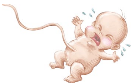
Imagen N. 16: Ilustración “Nacer en Casa”. El Comercio (2012).