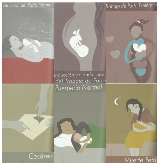
Ilustración 9: Collage con ilustraciones obtenidas de la Norma y Protocolo Materno .