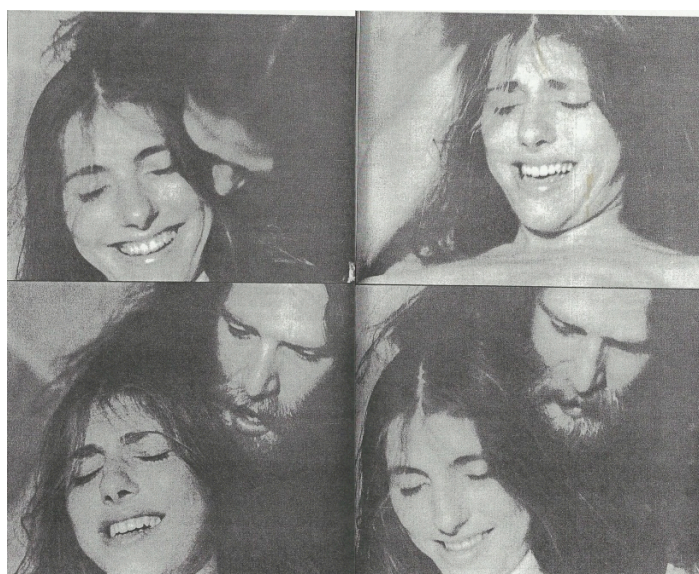
Imagen N. 10: Ensayo visual de un nacimiento.

No solamente los relatos de algunas de las interlocutoras de esta etnografía rompen con la representación predominante de la mujer que no está acompañada en la labor. El libro escrito por Ina May Gaskin, Spiritual Midwifery ([1975] 2002), también contiene, entre otras imágenes, las de la pareja dando a luz. Estas no solamente rompen con la norma por mostrar a las mujeres acompañadas sino también por mostrarlas con gestos faciales que denotan bienestar y alegría. A continuación se muestran algunas imágenes que pertenecen a un ensayo visual que se encuentra en el libro.