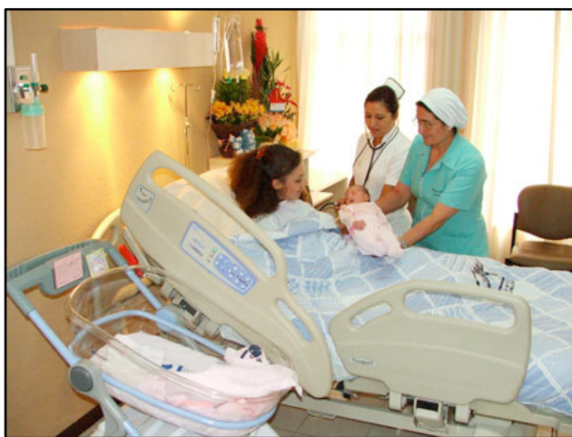
Imagen N. 15: Fotografía Clínica de la Mujer

La segunda fotografía, al parecer, fue tomada por el padre del bebé que vemos en ella, se encuentra en una página de Facebook que aparece cuando se busca “Hospital Metropolitano”, en esta red social. La imagen muestra el primer plano de un bebé recién nacido en un hospital, se puede saber que es recién nacido por la grasa que tiene en la cara y en los ojos, así como por la marca que tiene en su cabeza, se sabe que esta en un hospital porque en la mano tiene una etiqueta que probablemente indica sus apellidos. Esta sobre una cuna o un colchón, la madre no está presente, la luz es fuerte y el bebé está con los ojos cerrados, al contrario del bebé que se encuentra en la fotografía de la Clínica Primavera, junto a su madre. Esto denota la separación de la cría de su madre, característica dominante en los partos hospitalarios.