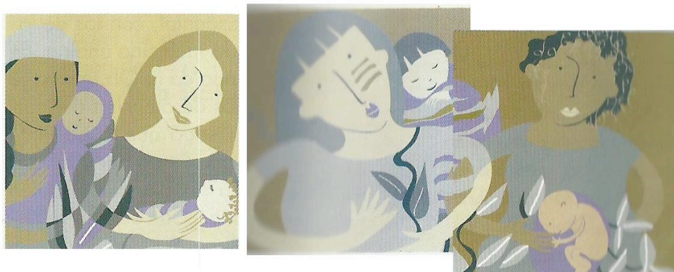
Imagen N. 6: Collage de imágenes de la GTAPCA.