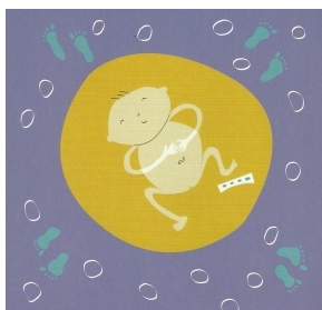
Imagen N. 11: Ilustración de la portada de la Norma y Protocolo Neonatal.

A propósito de la Norma y Protocolo Neonatal, cabe señalar que las ilustraciones que éste contiene, a excepción de las que promueven e indican la lactancia, muestran al embrión o al bebé solo. Solamente en una ilustración aparece una silueta tímida de la madre. Esto es interesante a nivel de representación porque a través de ellas no se genera el vínculo o la necesidad de que madre y cría permanezcan unidos. También se relaciona con el modo de representación que tienen las imágenes provenientes de los ecosonogramas, en dónde se descontextualiza al feto del cuerpo materno. Pollack, en su estudio sobre imágenes fetales (1997) ya discute y plantea la necesidad de recontextualizar al feto en la mujer, en este caso puesto que es posparto, con la mujer, al menos.