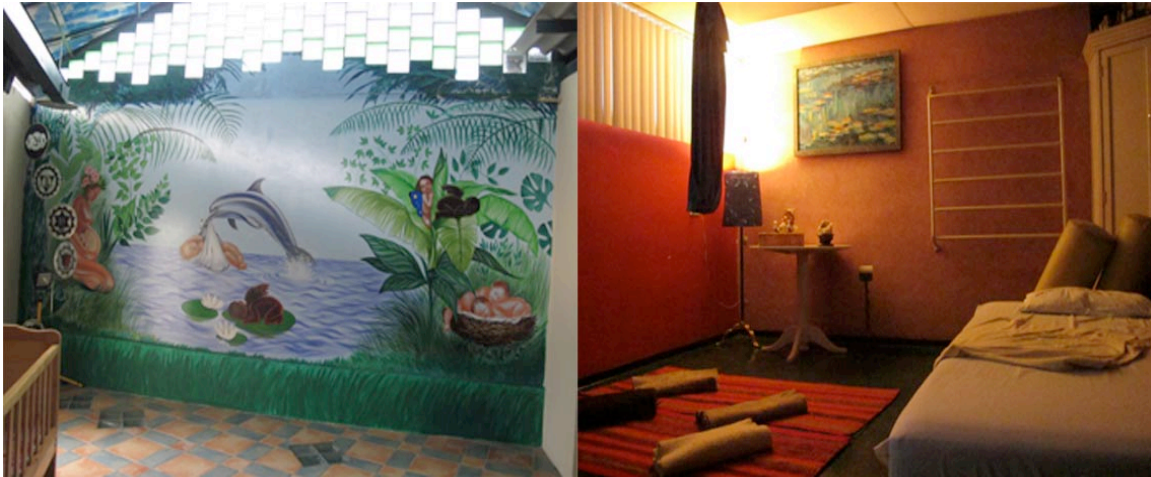
Imagen N. 3: Secuencia fotográfica de ambientes privados de la Clínica Primavera, Cumbayá.