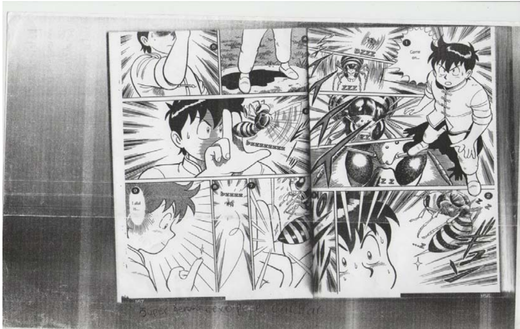
Lámina motivadora para los textos orales