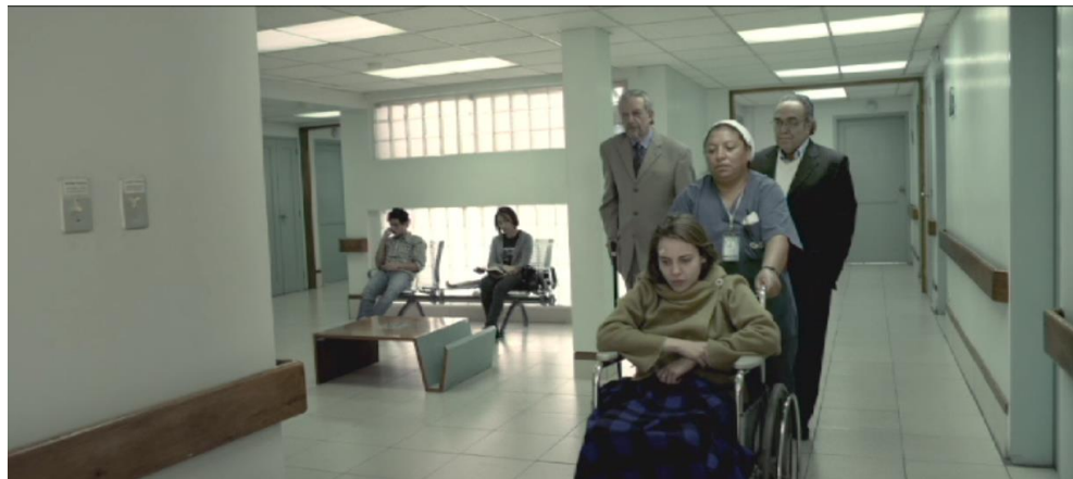
Figura 4. Cuadro de El Facilitador . Película de Víctor Arregui.