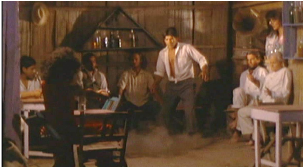
Figura 6. Cuadro de La Tigra . Película de Camilo Luzuriaga.