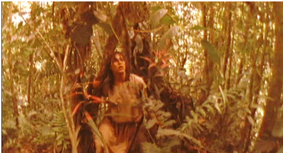
Figura 11. Cuadro de La Tigra . Película de Camilo Luzuriaga.