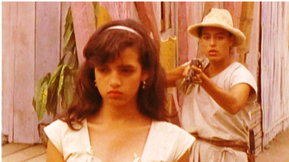
Figura 10. Cuadro de La Tigra . Película de Camilo Luzuriaga.