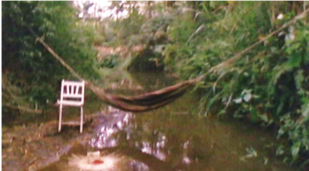
Figura 1. Cuadro de La Tigra . Película de Camilo Luzuriaga.