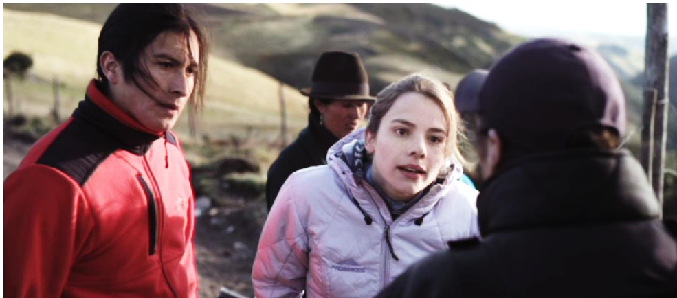
Figura 6. Cuadro de El Facilitador . Película de Víctor Arregui.