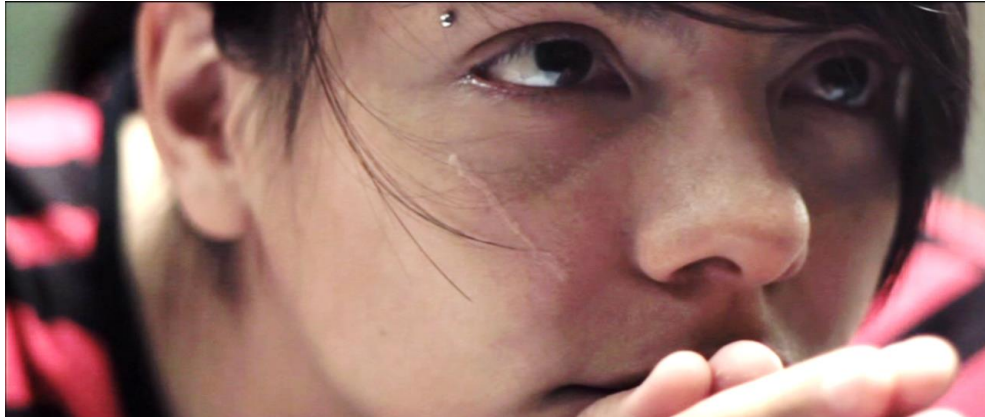
Figura 1. Cuadro de Sin Otoño, Sin Primavera . Película de Iván Mora Manzano.