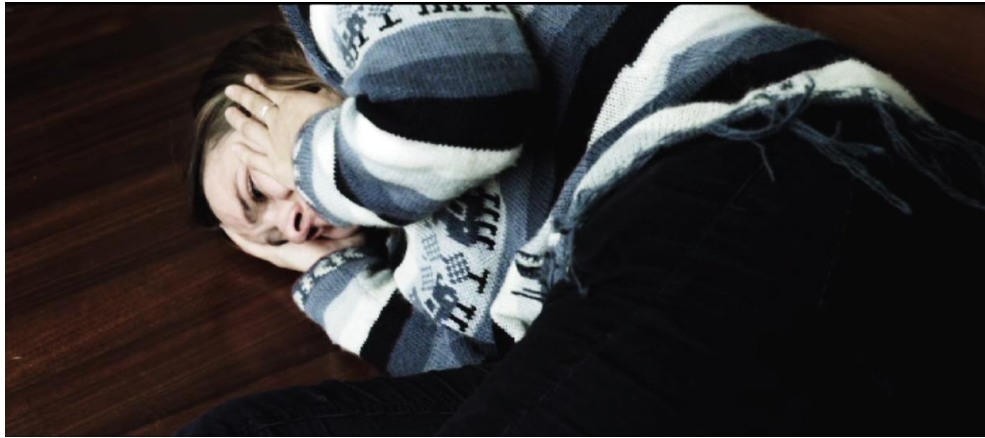
Figura 10. Cuadro de El Facilitador . Película de Víctor Arregui.