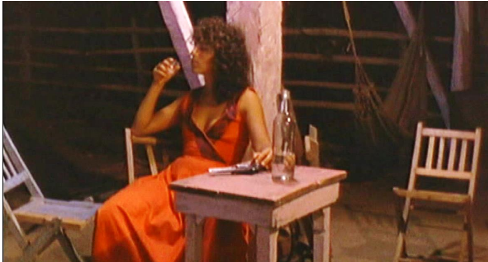
Figura 5. Cuadro de La Tigra . Película de Camilo Luzuriaga.