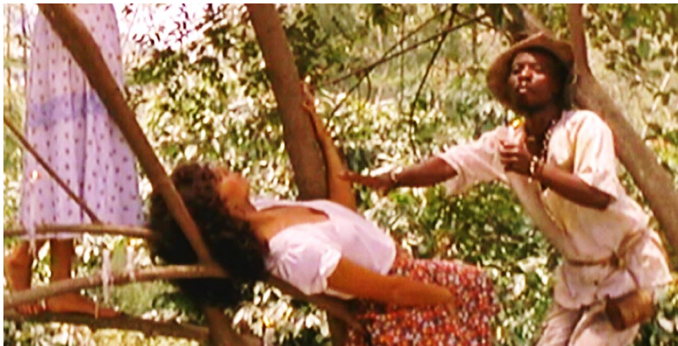
Figura 4. Cuadro de La Tigra . Película de Camilo Luzuriaga.