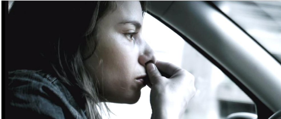
Figura 3. Cuadro de El Facilitador . Película de Víctor Arregui.