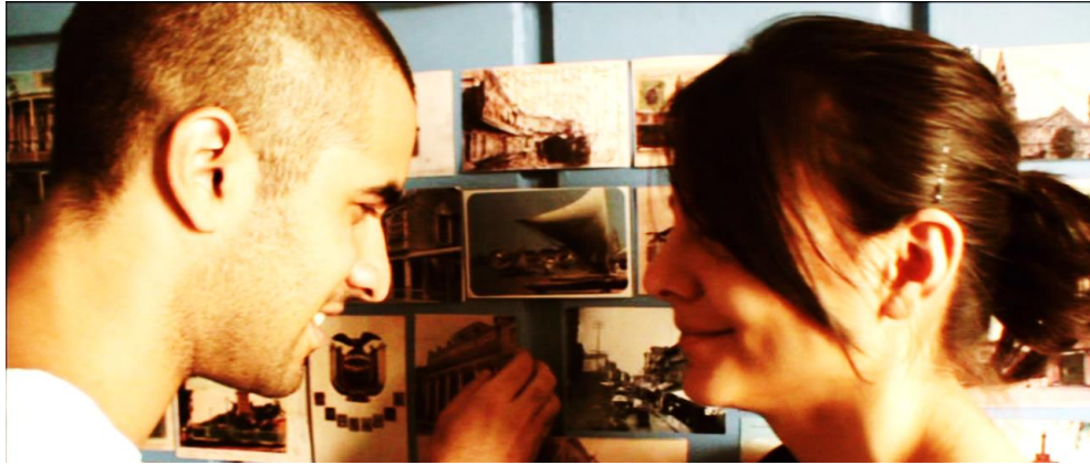
Figura 5. Cuadro de Sin Otoño, Sin Primavera . Película de Iván Mora Manzano.