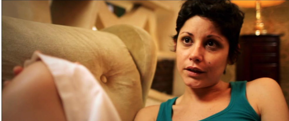
Figura 7. Cuadro de Sin Otoño, Sin Primavera . Película de Iván Mora Manzano.