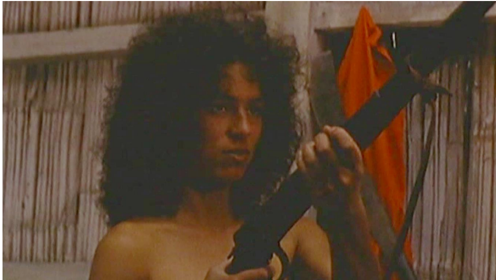
Figura 3. Cuadro de La Tigra . Película de Camilo Luzuriaga.