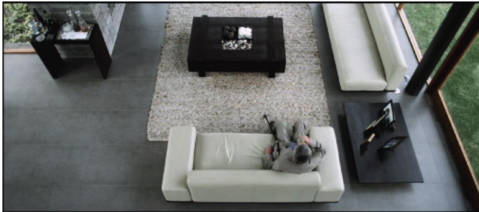
Figura 12. Cuadro de El Facilitador . Película de Víctor Arregui.