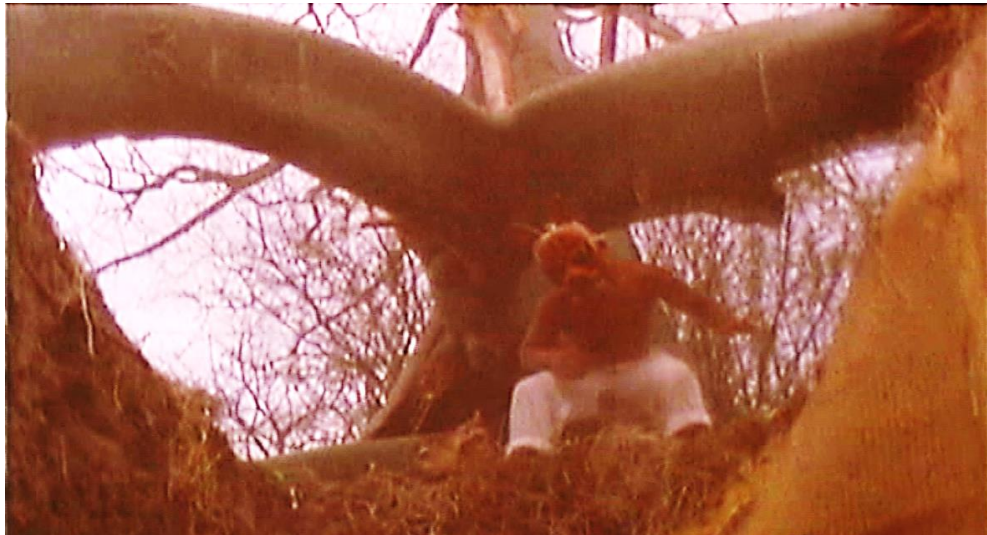
Figura 8. Cuadro de La Tigra . Película de Camilo Luzuriaga.