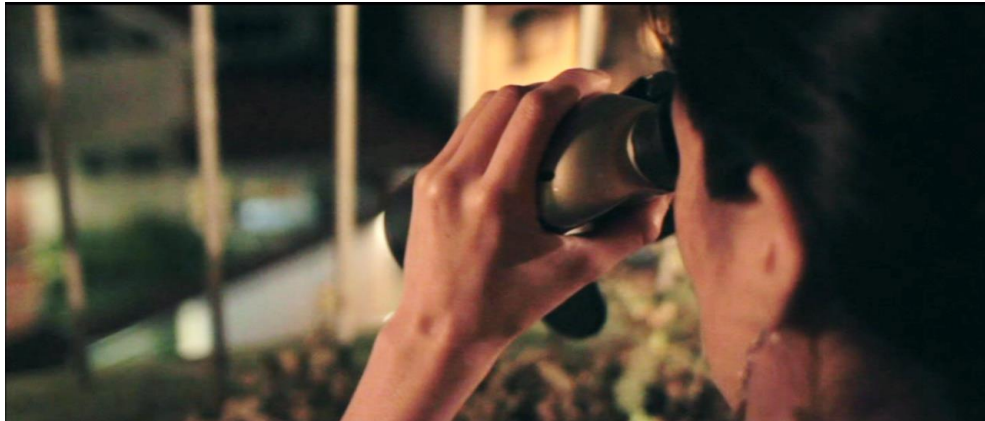
Figura 8. Cuadro de Sin Otoño, Sin Primavera . Película de Iván Mora Manzano.