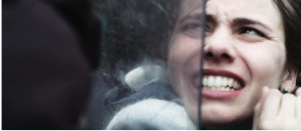
Figura 7. Cuadro de El Facilitador . Película de Víctor Arregui.