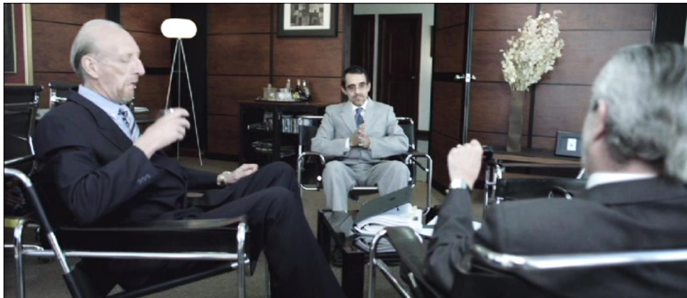
Figura 8. Cuadro de El Facilitador . Película de Víctor Arregui.