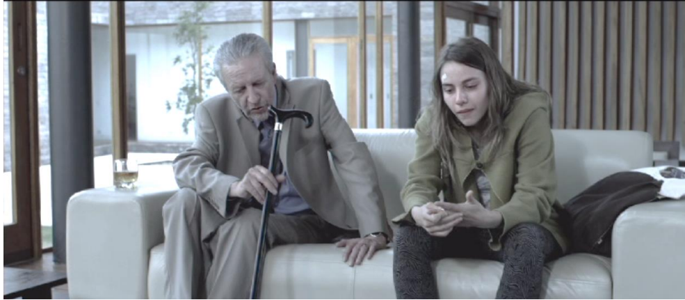
Figura 5. Cuadro de El Facilitador . Película de Víctor Arregui.