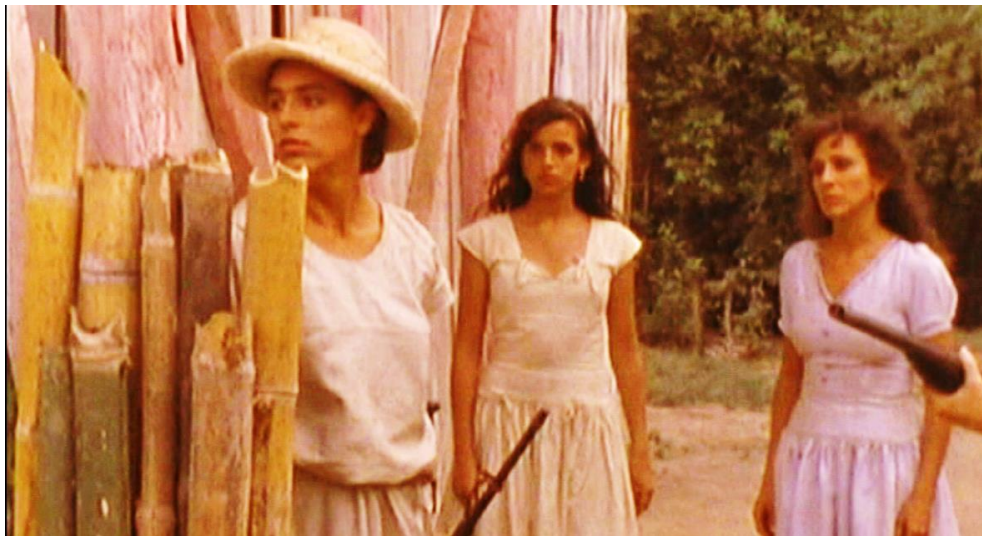
Figura 9. Cuadro de La Tigra . Película de Camilo Luzuriaga.