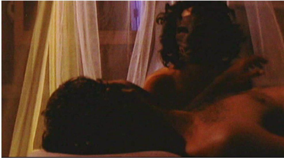
Figura 7. Cuadro de La Tigra . Película de Camilo Luzuriaga.