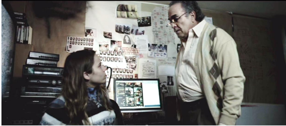
Figura 9. Cuadro de El Facilitador . Película de Víctor Arregui.