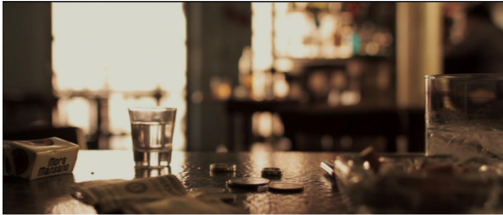
Figura 11. Cuadro de Sin Otoño, Sin Primavera . Película de Iván Mora Manzano.