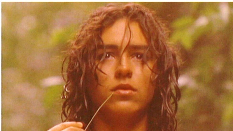
Figura 12. Cuadro de La Tigra . Película de Camilo Luzuriaga.