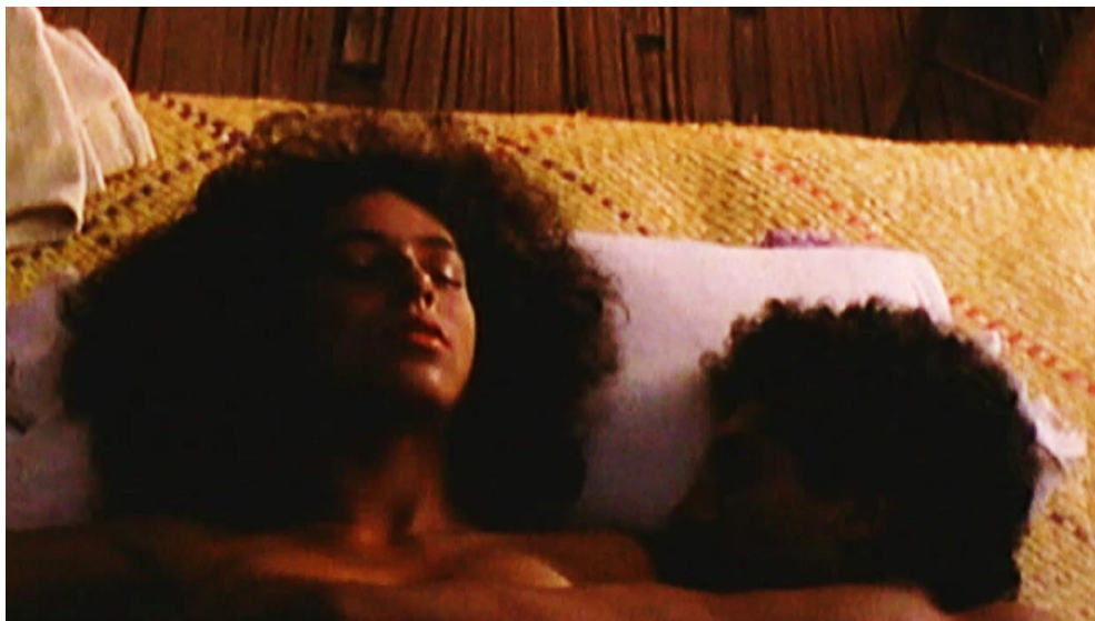
Figura 2. Cuadro de La Tigra . Película de Camilo Luzuriaga.