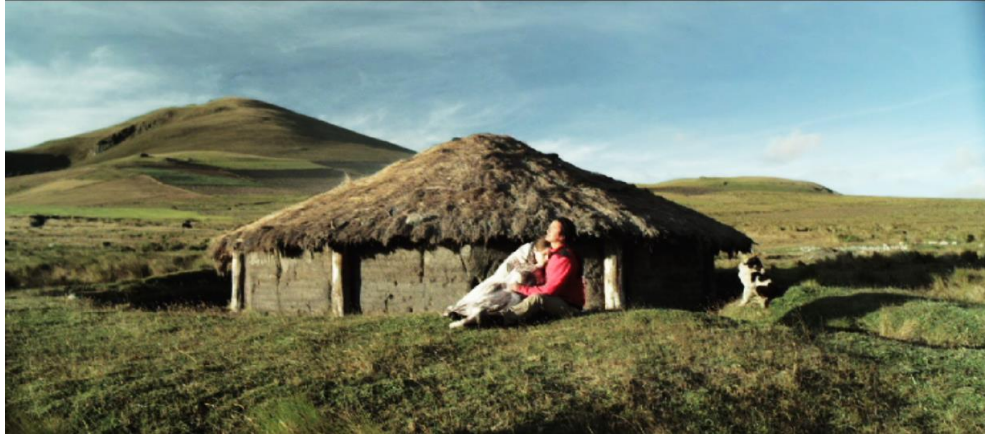
Figura 11. Cuadro de El Facilitador . Película de Víctor Arregui.