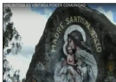
Fuente: Noticias Ecu (Piedra “Chilintosa” es visitada por la comunidad).

La Chilintosa, es una piedra de seis metros de altura por 32 metros de radio expulsada en la erupción del volcán Cotopaxi en 1877; es objeto de peregrinación desde inicios del siglo pasado por creyentes de la zona. La Iglesia Católica preocupada por este fenómeno, mandó a pintar la figura de la Virgen de la Merced 50 en la piedra. A este lugar acude la gente a hacer peticiones, entre ellas ser protegidos de la erupción del volcán Cotopaxi. Ahora que el volcán volvió a estar activo, las visitas a “La Chilintosa” han aumentado en un 200% según el párroco de la zona 51 (Noticias Ecu, 2015).