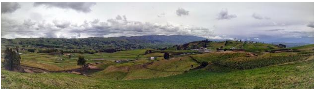
(paisaje de Cumbijín).