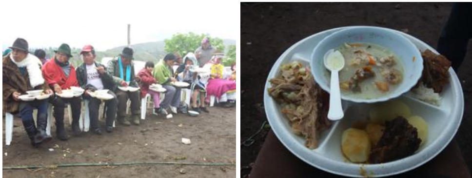
Autora: Marisol Rodríguez Pérez (Abundante comida brindada por los priostes).

Las fiestas ayudan a crear un ambiente de compañerismo y solidaridad que consolida la unidad de las comunidades (Albó, 1994: 95-96- 97), abonan las relaciones comunitarias, se comparte comida, música, bailes y ritos que contribuyen a fortalecer los lazos comunitarios. La fiesta incluye el desfogue de tensiones acumuladas a lo largo del año, lo que evita problemas que podrían dividir a la comunidad, el alcohol vincula a las personas distanciadas. Compartir la bebida y la comida contribuye a crear vínculos, mientras se degusta del menú se conversa y se accede a personas que en la vida cotidiana no están al alcance, porque no viven en la comuna o porque tienen un mayor estatus. La comida es una ocasión para recrearse y consumir mucha proteína (pollo, cuy, res, chanco). Con la copiosa comida se agradece la abundancia de las cosechas y el aumento de los animales domésticos.