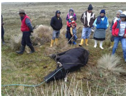
Autora: Marisol Rodríguez Pérez (Ofrenda del Toro al Cerro).

Ejemplo de ello es el toro sacrificado como ofrenda al cerro que también se ofreció como comida a los invitados en Cumbijín en la fiesta del Día de los Humedales como se observa en la fotografía precedente.