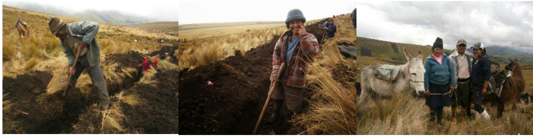
Autora: Marisol Rodríguez Pérez (Izq. y centro Anciano y mujer trabajando en la minka. Der. Preparándose para bajar a la casa después de la minka en el páramo).

Frente a la demanda de sus vertientes la comunidad se planteó en 2015 conducir esta agua en beneficio de su población, para lograrlo organizaron mingas, pusieron cuotas y consiguieron apoyo institucional en, maquinaria y apoyo técnico. Solicitaron a la hacienda cercana a Potrerillos y Llamahuasi que colaboren con materiales (varillas). Las instancias organizativas (Junta de Agua, Comunidad y Junta de Riego) pusieron otros materiales. Todos aportaron para mejorar las condiciones de vida de la comunidad. Los comuneros no esperan ni dependen del estado para solucionar sus problemas, son proactivos y buscan que este ponga una parte.