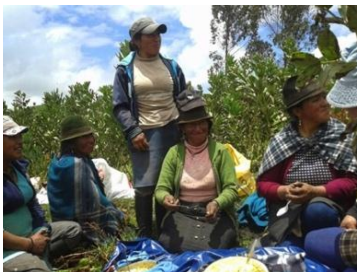
Autora: Marisol Rodríguez Pérez (Compartiendo alimentos en la cosechas de habas).

habas en la que participé de un grupo de diez personas, nueve eran mujeres. En la cosecha de papas hay una participación más equitativa de hombres y mujeres. En las cosechas, las y los ayudantes reciben su pago con el producto cosechado. Rara vez se contrata gente a la que se le paga con un jornal. Estas relaciones continuas fortalecen los lazos de proximidad que tienen como resultado que vecinos y amigos potencialmente formen parte del ayllu al establecerse alianzas matrimoniales, como dice Jorge Naula (2016, entrevista) “Ahora, todavía se casan entre gente de las comunidades, entre gente tanto de Cumbijín, Papaurco, Chambapongo, Galpón, Sacha, Laivisa, Toaylin, todo eso, no hay fronteras ni hay límites”.