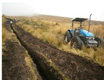
Autora: Marisol Rodríguez Pérez (Zanja y tractor que apoya trabajo en la minka).

Así lograron frenar los intentos del estado a través de los GAD y/o la SENAGUA de apropiarse o disponer del agua del territorio comunal. El plan consistía en programar minkakuna comunitarias, poner cuotas y gestionar ante los gobiernos locales maquinaria para facilitarlas. Se logró apoyo del GAD cantonal y provincial, gracias que Pachakutik ganó las elecciones en la provincia y en Salcedo, donde llegó gracias a una alianza entre Pachakutik y un movimiento local. Así se explica la utilidad de participar en el ámbito electoral, ya que de no hacerlo las comunidades estarían excluidas de los beneficios en obras, financiamiento o políticas que llevan a cabo las autoridades locales. En las minkakuna la maquinaria es buena aliada, pues disminuye bastante el tiempo de trabajo.