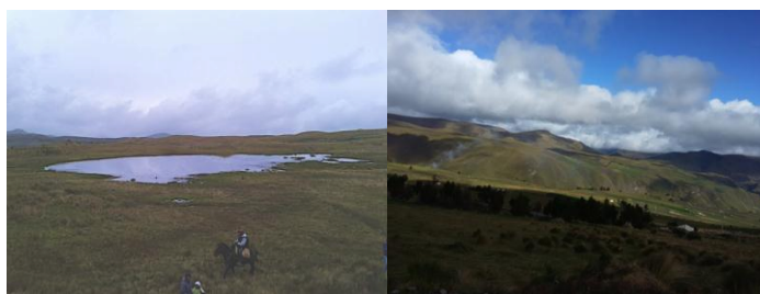
Autora: Marisol Rodríguez Pérez. (Izq.: Laguna de Anteojos y der.: Paisaje de páramo Comunidad Cumbijín).

frontera agrícola está minando este ecosistema. La mayor parte del páramo 20 lo constituyen los pajonales ( Stipa ichu ) que albergan “arbustos, hierbas, almohadillas y rosetas gigantes”; sus quebradas constituyen microclimas que albergan “arbolitos, arbustos leñosos y plantas herbáceas que forman verdaderos matorrales cerrados y exuberantes” (INEFAN, 1998, 22). En los lugares pantanosos del páramo crecen “almohadillas súper compactas y las partes que van muriendo se depositan en el fondo donde poco a poco se convierten en turba” (INEFAN, 1998: 22). Estas conservan la humedad y permiten almacenar el agua que luego forma ojos de agua y ríos. Además, en el páramo se encuentran conejos, osos, lobos, dantas, venados, sachacuy, cóndores, sibricabras y truchas en un escenario que atrae turistas.