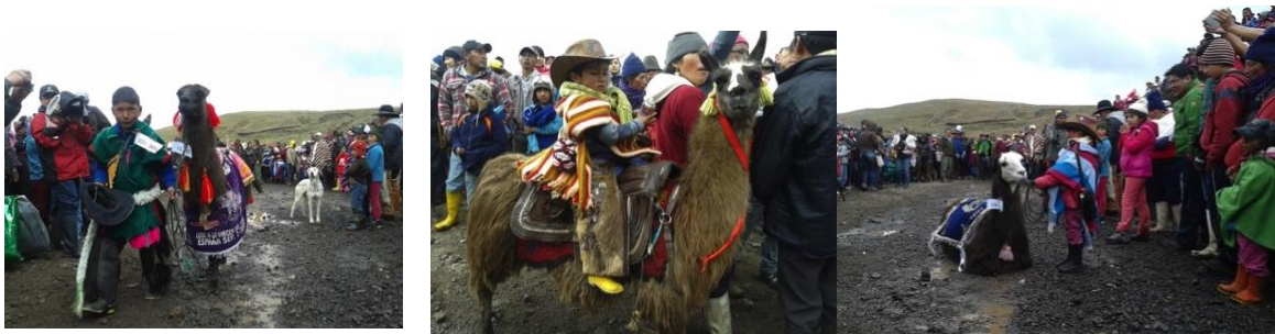
(Concurso de Llamas en el Día de los Humedales).

Los eventos más esperados son la elección de la llama bonita y la carrera de llamas. En los concursos participan activamente niñas y niños. Se premia el ajuar de la llama y sus dueños y la originalidad con la que han sido adornados los camélidos que son presentados al público por sus nombres. Esto concitó mi atención, pues tener un nombre muestra la relación cercana entre las familias y estos animales y expresa el lugar que estos seres tienen en las familias comuneras.