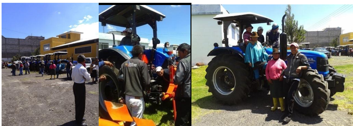
Autora: Marisol Rodríguez Pérez (Entrega del tractor el día de la Marcha de la CONAIE).

La comunidad discutió si ir a la entrega del tractor que requirió de la construcción del centro de maquinización y el esfuerzo del presidente de la comunidad para conseguir una serie de documentos prácticamente imposibles de obtener, pero que él haciendo gala de su ingenio logró conseguir, también discutió si ir a la marcha convocada por la CONAIE. La decisión fue salomónica iría solo una comisión de 10 personas a retirar el tractor y al medio día iría un bus del transporte comunitario a sumarse a la marcha de la CONAIE.