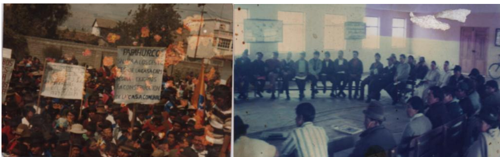
(Izq.: Marcha para exigir fondos. Der.: Formación de los dirigentes de las comunidades de Salcedo).

En las siguientes fotos se aprecia el carácter reivindicativo de esta obra de la Iglesia, la primera muestra una marcha indígena que inicia en la Casa Campesina para solicitar y exigir apoyo al gobierno, y la segunda un curso de formación que tiene lugar en la misma.