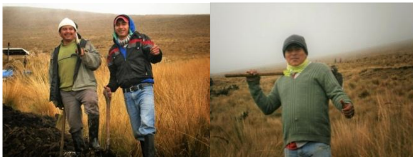
Autora: Marisol Rodríguez Pérez ( Minka en Llamahuasi ).

La forma moderna de vivir en la comunidad se observa en los jóvenes que combinan las tareas tradicionales con sus nuevas experiencias tecnológicas. Conocen del mundo globalizado y el de su realidad local. Usan celulares, redes sociales y acompañan a sus padres a las mingas. Esto lo percibí durante una minga, cuando fotografiaba a la gente de la comunidad en Llamahuasi. Cuando les pedí que se dejaran tomar una foto, posaron, me sonrieron y dijeron “para el Face” (Facebook).