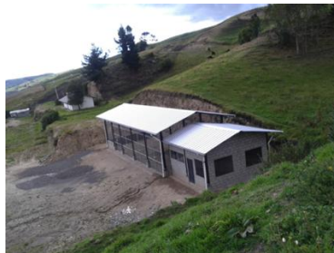
Autora: Marisol Rodríguez Pérez (Centro de maquinización en Cumbijín).

valores. Hechos como estos, cuestionan los discursos hegemónicos que consideran como un fenómeno imparable la globalización que “supone la universalización de la modernidad de corte euro-americano” (Escobar, 2005:11).