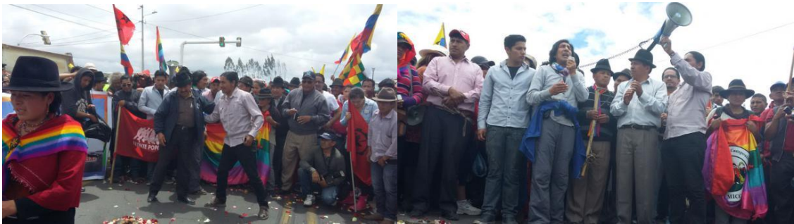
(Recibimiento de la FECOS a la Marcha indígena de la CONAIE “Así se desarrolló la marcha indígena este 9 de agosto” de 2015).

respecto a los territorios de las comunidades. Al mismo tiempo, sirvió para que se unieran los dirigentes para defender la comunidad y acercó a Cumbijín y la FECOS con la CONAIE. Esto se pudo observar en agosto de 2015 cuando la FECOS alimentó y hospedó en la Casa Campesina a las y los caminantes de la Marcha Indígena que venía de Zamora en protesta contra el extractivismo, la criminalización de la protesta y el irrespeto del régimen hacia los derechos colectivos.