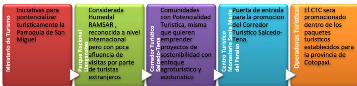
Gráfico No. 2 Cadena de Valor del Centro Turístico Monasterio Santa María del Paraíso

Fuente: Luna y Villacreses. Elaboración: Luna y Villacreses (2013: 121).