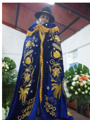
Autora: Marisol Rodríguez Pérez (San Antoñito con regalos de los priostes y dinero).

La fiesta como ritual es un modo de agradecer a lo sagrado, es una experiencia trascendente que celebra a lo divino bajo la forma de un santo o santa. Se agradece por las buenas cosechas, por la vida y la salud. Es un tiempo donde también se aplica la reciprocidad con lo sagrado, se le agasaja con flores, dinero, velas, vestidos y a cambio se le pide con confianza favores.