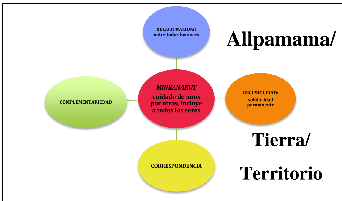
Gráfico 1. Relación del minkanakuy como valor con los principios andinos