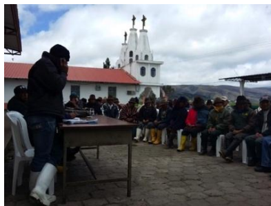
Autora: Marisol Rodríguez Pérez (Asamblea en la comunidad de Cumbijín).

En Cumbijín se valoran las asambleas. En las reuniones o asambleas se llama la atención a quienes no asisten a las reuniones, comisiones, minkas y si aun así las cosas no funcionan, el colectivo pone límites y sanciones. Un dirigente dijo en una frase algo que muestra la obligatoriedad del trabajo comunal: “Aquí nadie se va a librar del trabajo de la acequia”. A más del trabajo, la directiva con la anuencia asamblearia cobra cuotas ocasionalmente y multa a quien incumple la “ minka ” o no participa en las Asambleas, aunque lo ideal no es cobrarlas, sino que la gente participe.