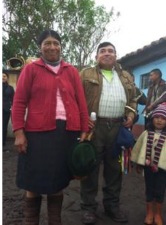
Autora: Marisol Rodríguez Pérez (El orgullo de ser priostes).

A eso se suma la gracia que se pide para que aumenten los animales, que no son capital de trabajo de los comuneros, sino parte integrante del ayllu (César Pilataxi, comunicación personal, 2015), por eso se les da un nombre. Entonces, pedir al Santo o más bien dicho al Cerro o al Urcoyaya (el dueño de todo lo que existe en el páramo, plantas, pajaritos, conejos...) que multiplique los rebaños o que incrementen las vaquitas es esencial para incrementar el ayllu y alejar la posibilidad de ser wakcha . Para profundizar este argumento respecto de la pertenencia de los animales al ayllu , cito el testimonio de una joven intelectual kayambi sobre la relación de su mamá con la vaca que cuidaba, en un contexto de fuerte cambio cultural.