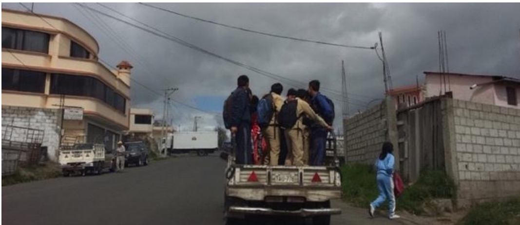
Autora: Marisol Rodríguez Pérez. (Compartiendo experiencias comunes).

En Cumbijín la cercanía de los lazos de parentesco como señala Sahlins se experimenta cuando se comparten similares experiencias como: gozar del ecosistema de páramo y de su amplio paisaje; realizar las mismas actividades productivas: agricultura, ganadería, crianza de animales menores, beneficiarse del ecosistema donde viven y disfrutar de los paisajes; gozar de los beneficios de instituciones comunales como la minka y la reciprocidad que aluden a valores comunitarios que les permiten enfrentar conflictos similares de forma colectiva; compartir experiencias como transportarse desde y hacia la comunidad. En ese compartir cotidiano la gente se conoce, forja su subjetividad, aprende de los otros y encuentra a sus potenciales esposas o esposos.