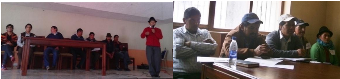
Autora: Marisol Rodríguez P. (Izq: Mesa directiva FECOS, Der. Participación minoritaria de mujeres en la dirigencia).

Esta forma de actuar guiada por valores comunitarios muestra cómo los dirigentes cada uno a su estilo, buscan negociar con el estado que emprende iniciativas capitalistas. Los dirigentes usan tácticas que ayudan a la comunidad a enfrentarse con el mercado en mejores condiciones, sea forzando una redistribución del agua o reemplazando el ganado bovino (que deteriora los suelos y seca las vertientes) por alpacas adaptadas al páramo o creando mecanismos para mediar sus relaciones económicas con productos en vez de dinero como en el caso de la Asociación Sierra Nevada, ejemplo que se analizará más adelante.