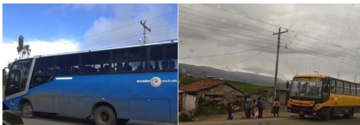
Autora: Marisol Rodríguez Pérez (Transporte público propiedad particular de comuneros de Cumbijín)

Cumbijín a diferencia de la mayoría de comunidades, tiene una buena vía de acceso, allí operan cinco buses de cinco comuneros que cambiaron sus camionetas para dar el servicio de transporte a la población oriental. Cuatro de ellos están relacionados con la familia Salazar del dirigente de Agua de Riego, descendientes de un hipo . Otro dueño es primo del presidente de la comunidad y otro primo suyo, tuvo un bus que se accidentó y ya no está en circulación 82 . Los dueños de los buses son parte del Transporte Comunitario. Ellos han tenido dificultades con las empresas de buses de Salcedo y Ambato que quisieron cubrir la ruta Salcedo- Laivisa, que es la que ahora ellos cubren. En las fotos que siguen a continuación se aprecia el servicio que dan los comuneros de Cumbijín. La gente de otras comunidades no tiene buses, así que los cinco transportistas de Cumbijín dan el servicio a toda la zona.