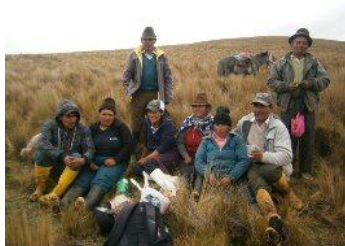
Autora: Marisol Rodríguez Pérez (Compartiendo el kukayo de la minka).

expectativa de encontrar una pareja que podría ser la futura esposa o esposo que fortalezca el ayllu .