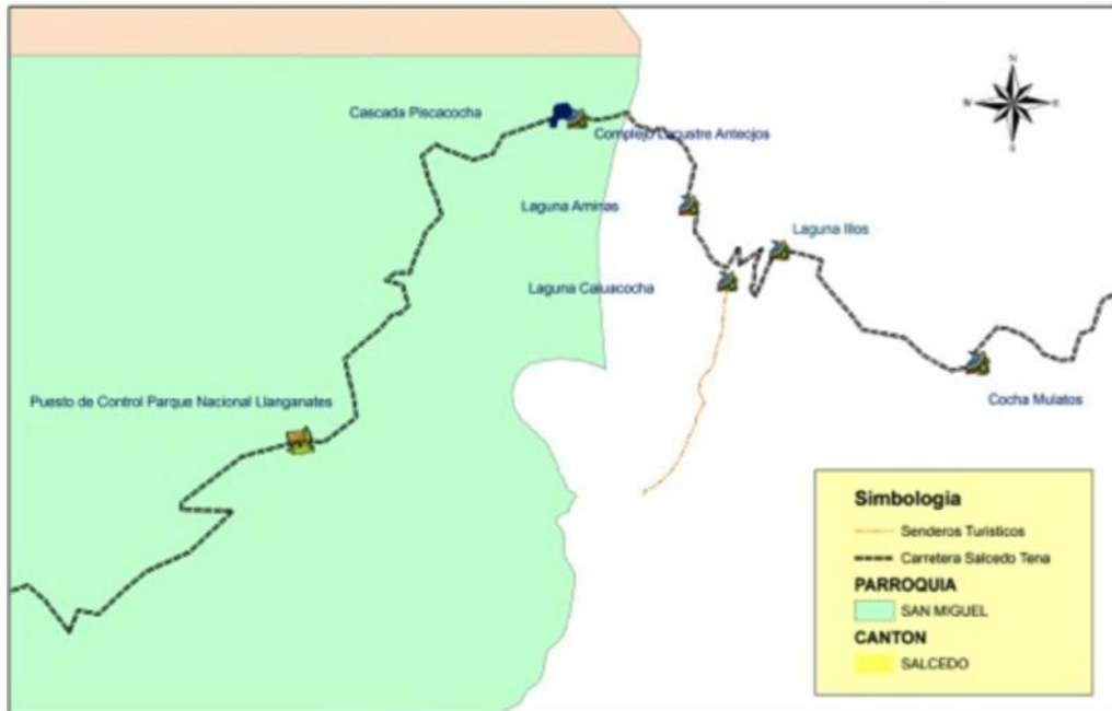
Mapa No. 2 “Atractivos turísticos” de las comunidades Cumbijín y Sacha

Fuente: Luna y Villacreses. Elaboración: Luna y Villacreses (2013: 26).