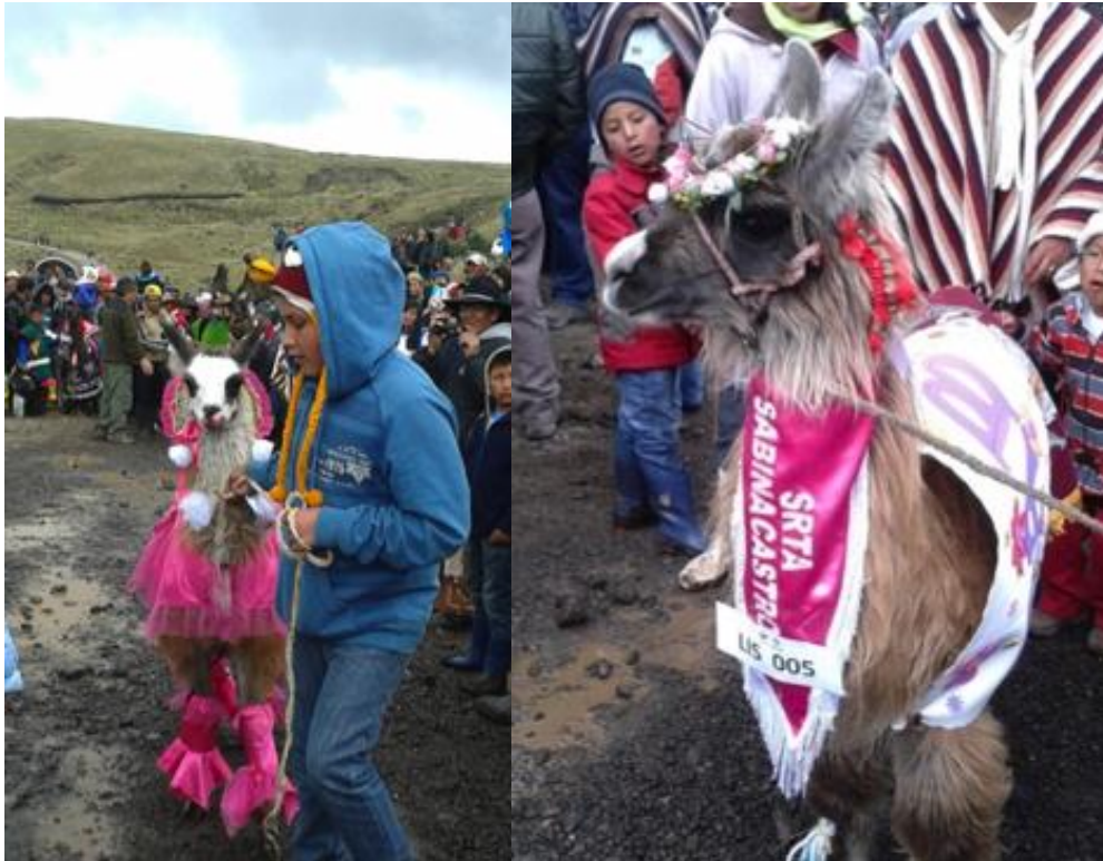
(Izq. Llama vestida de quinceañera. Der. llama con nombre en la pañoleta).

Estos eventos muestran como los rituales andinos persisten de forma tradicional, como el caso descrito por Tomoeda, o se acomodan a las nuevas circunstancias, como en el caso de Cumbijín que aprovecha de un festejo introducido por el estado para manifestar rituales relacionados con los seres que habitan el páramo, sean estos llamas, lagunas o el páramo ( Urcoyaya ).