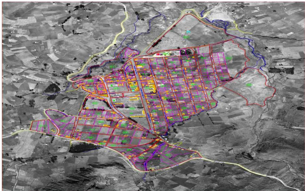
Figura 2: Carta topográfica de la parroquia Zumbahua. Fuente: INEC, 2012. Elaborado GAD Parroquial Zumbahua.

En la actualidad, de acuerdo a los datos del Censo 2010, realizado por el INEC, la población total de la Parroquia Zumbahua es de 12.643 habitantes, de los cuales 5924 hombres y 6719 mujeres. La mayoría de moradores viven migrando a las ciudades de Quito, Latacunga, Quevedo, La Maná y Ambato; debido a la difícil situación económica