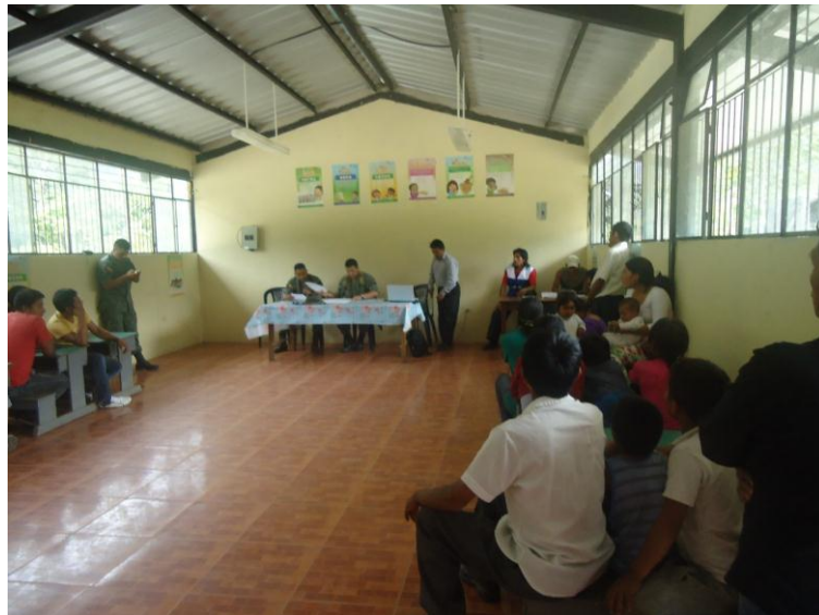
Sesión con el comandante del Batallón de Zamora Chinchipe y la comunidad.