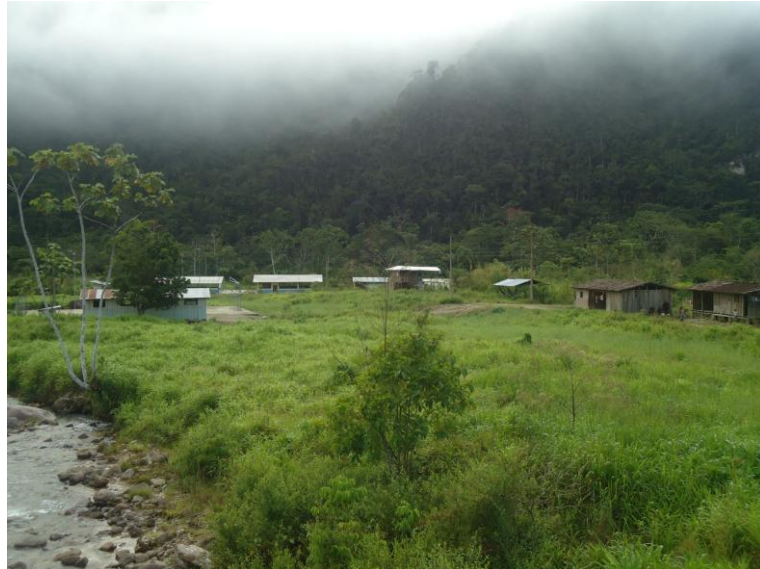
La comunidad shuar Wants parte frontal